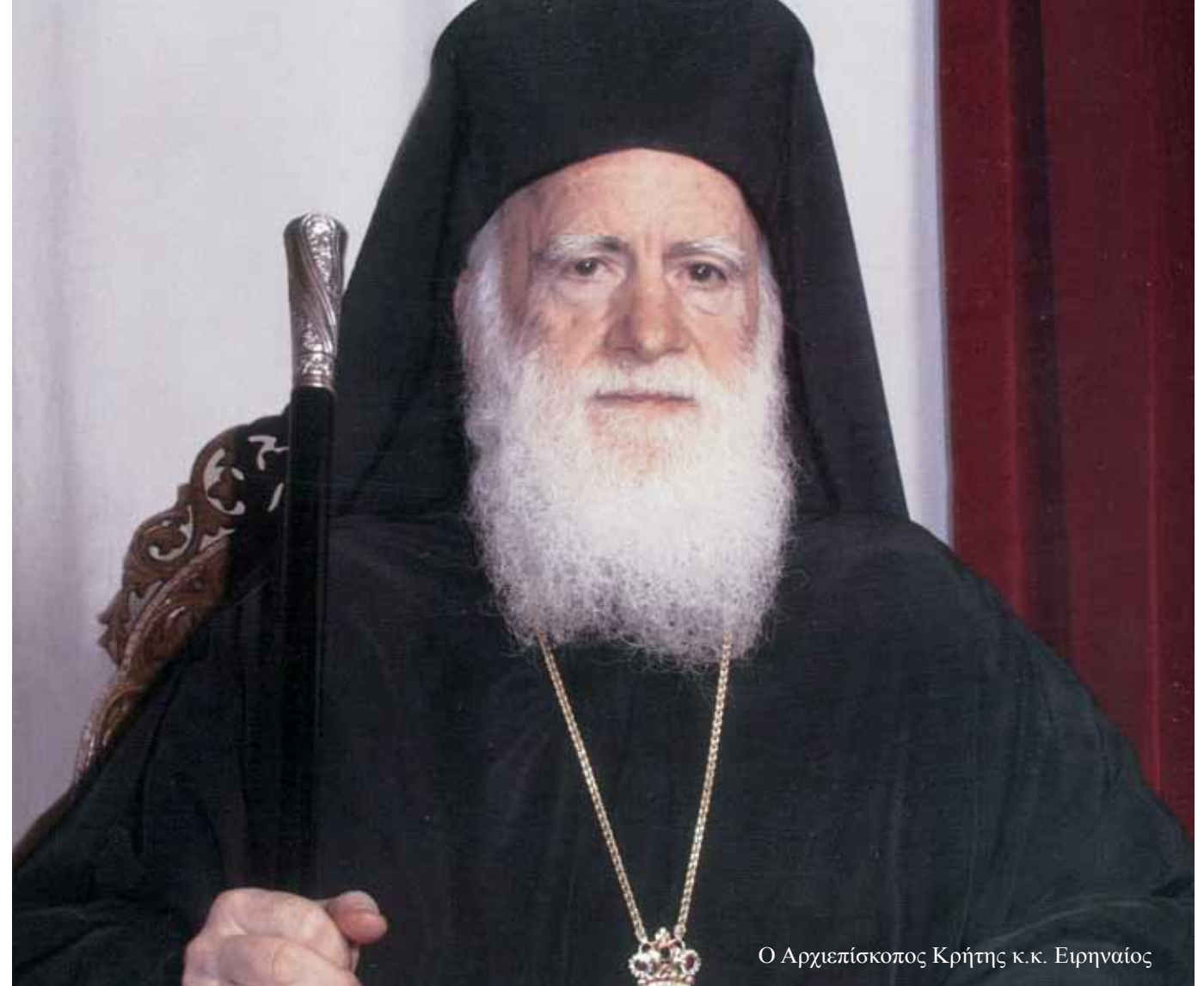
Ο Αρχιεπίσκοπος Κρήτης κ.κ. Ειρηναίος

Η Ιερά Αρχιεπισκοπή Κρήτης αγωνίζεται με τα συσσίτια των Ενοριών και τα Ενοριακά Φιλόπρωτα Ταμεία, να καλύψει τη βασική ανάγκη της τροφής για όλους εκείνους που κατά δεκάδες προστρέχουν για τήν καθημερινή σίτισή τους. Επίσης, με το νεοσύστατο φορέα «Το Ταμείο της Αγάπης του Θεού» προσπαθεί να καλύψει βασικές ανάγκες, όπως το νερό, το ρεύμα και τα φάρμακα σε πολλούς συνανθρώπους μας. Μια άλλη δράση, είναι η «Διακονία της Αγάπης», η οποία προσφέρει σε καθημερινή βάση τρόφιμα και ρούχα σε δεκάδες οικογένειες συνανθρώπων μας. Επιπλέον, έχει δημιουργηθεί η Ομάδα Στηρίξεως Μοναχικών Ασθενών, η οποία συμπαρίσταται στους μοναχικούς ασθενείς στα Νοσοκομεία ή κατ' οίκον, προσφέροντας πολύτιμη βοήθεια και συμπαράσταση. Τέλος, κατά τη διάρκεια του καλοκαιριού, λειτουργούν οι παιδικές Κατασκηνώσεις της Ι. Αρχιεπισκοπής Κρήτης «ΑΝΩ ΠΟΛΙΣ» στην Ανάπολη Πεδιάδος, όπου πολλά παιδιά του Τόπου μας έχουν τη δυνατότητα να περάσουν μερικές ημέρες ξεγνοιασιάς μέσα στη φύση.