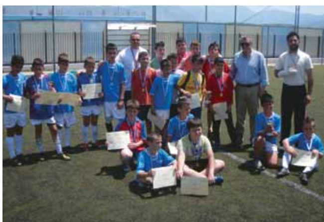
2ο Σχολικό πρωτάθλημα ποδοσφαίρου 5X5 στο Δήμο Μινώα Πεδιάδας - Κρήτης