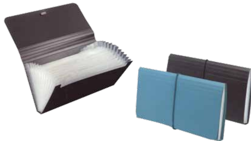
Φάκελος αρχειοθέτησης σε χρώμα μαύρο (26x13,5 εκ.)

Κορδόνι λαιμού με μεταλλικό κλιπ διαστάσεων (ύψος 60)