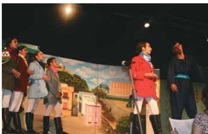
«Το Μεγάλο μας Τσίρκο» από το Καπετανάκειο και το Σχολείο Δεύτερης Ευκαιρίας