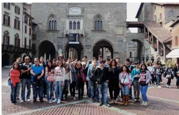
Οι μαθητές του 9ου Γυμνασίου Ηρακλείου πρεσβευτές ελληνικού πολιτισμού στο Μιλάνο