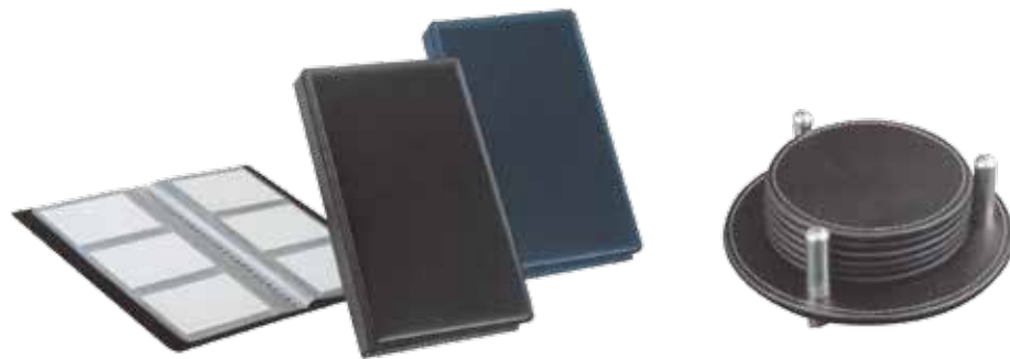
Καρτοθήκη 72 θέσεων διαστάσεων (19x11,5 εκ.)