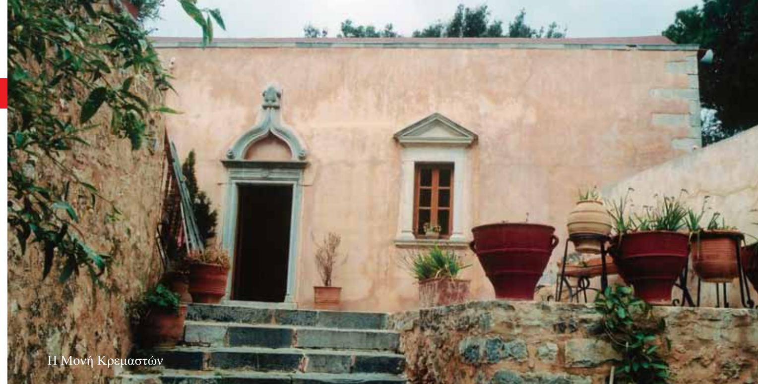
Η Μονή Κρεμαστών

Θα πρέπει τώρα να αναφέρουμε λίγα λόγια και για τον φλογερό πατριώτη, ιεράρχη Πέτρος Μελέτιο Χλαπουτάκη ανα-