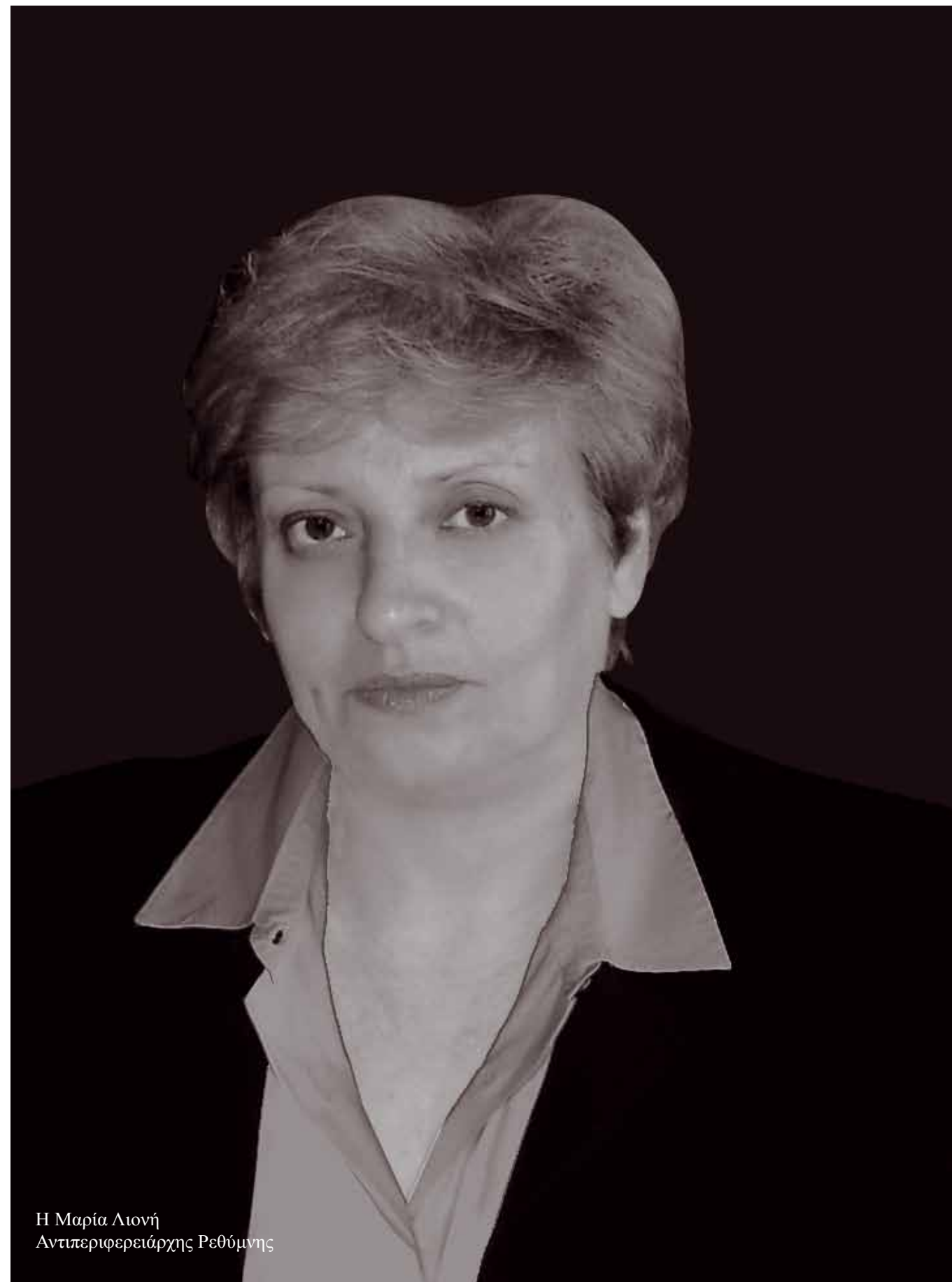
Η Μαρία Λιονή Αντιπεριφερειάρχης Ρεθύμνης

Από το Δεκέμβριο του 2009 έως το Δεκέμβριο 2010 διετέλεσε Γενική Γραμματέας της Περιφέρειας Κεντρικής Μακεδονίας.