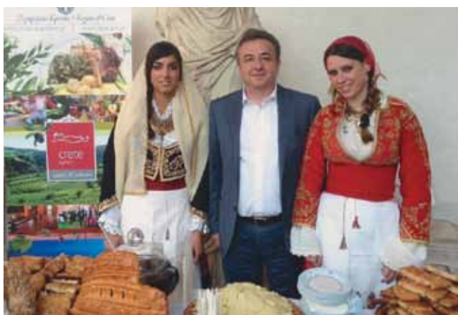
Ο Περιφερειάρχης Κρήτης Σταύρος Αρναουτάκης στο Μεσογειακό Φεστιβάλ «Cerealia 2013» στη Ρώμη