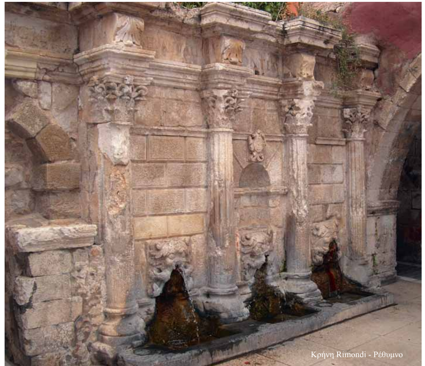
Κρήνη Rimondi - Ρέθυμνο

«Υποβλενογόνο Ινομόωμα της Μήτρας. Συμπτώματα και Θεραπεία» από τον Δρ. Αντώνη Μαραγκουδάκη, Διδάκτωρ Γυναικολογίας Πανεπιστημίου Αθηνών.