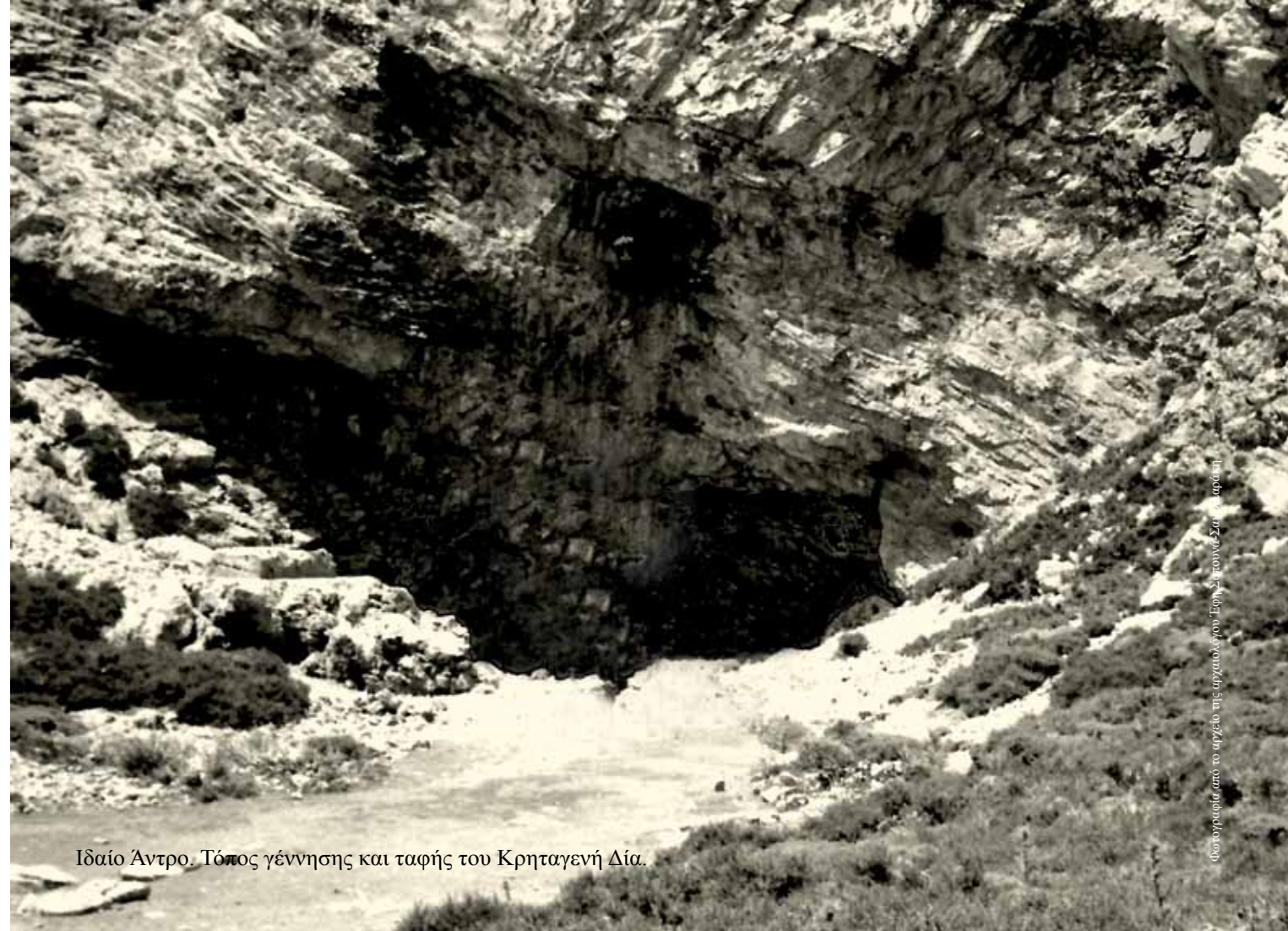
Ιδαίο Άντρο. Τόπος γέννησης και ταφής του Κρηταγενή Δία.

Κατά το Β' Παγκόσμιο Πόλεμο, το Ρέθυμνο βομβαρδίστηκε από τους Γερμανούς και πολλά κτήρια καταστράφηκαν. Εξαιτίας των ιδιαίτερων χαρακτηριστικών της, η Παλιά Πόλη χαρακτηρίστηκε το 1967 Ιστορικό Διατηρητέο Μνη-