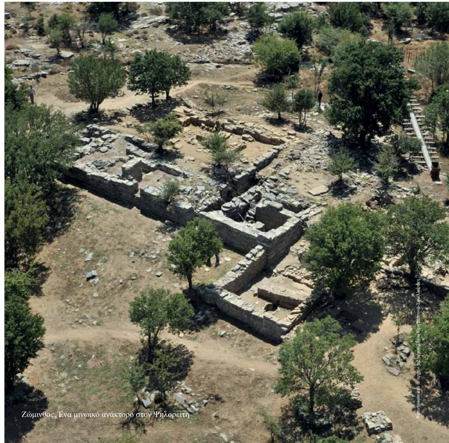
Ζώμινθος. Ένα μινωικό ανάκτορο στον Ψηλορείτη

Η παλαιότερη χρονολογία που σχετίζεται με το μοναστήρι είναι του έτους 1594, και είναι χαραγμένη σε μια καμπάνα του μοναστηριού. Η πρώτη ονομασία της Μονής (πριν το 1700), σύμφωνα με την παλαιά ορειχάλκινη σφραγίδα της είναι: «του Μεγάλου Ποταμού κατά την νήσον Κρήτην». Για τη σημερινή ονομασία το πιο πιθανό είναι ότι κάποιος ιερομόναχος με το επώνυμο Πρέβελης, της μεγάλης Ρεθε-